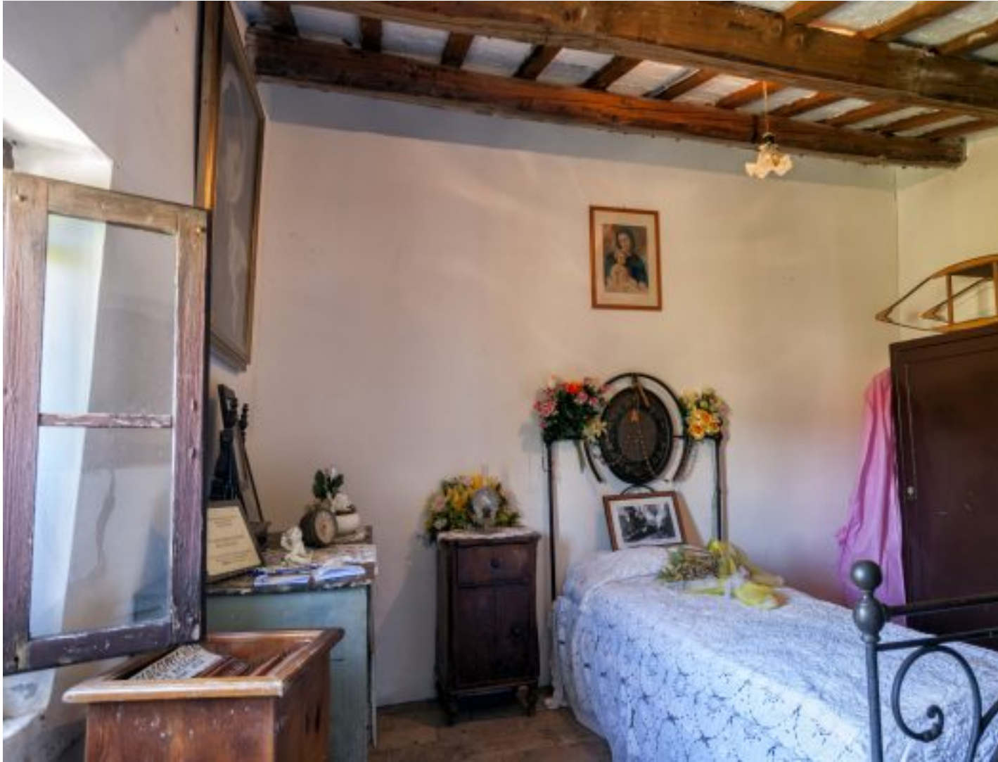
Habitación de santa María Goretti, Italia

“La pureza de corazón, como toda virtud, exige un entrenamiento diario de la voluntad y una constante disciplina interior. Requiere, ante todo, invocar asiduamente a Dios en la oración”.