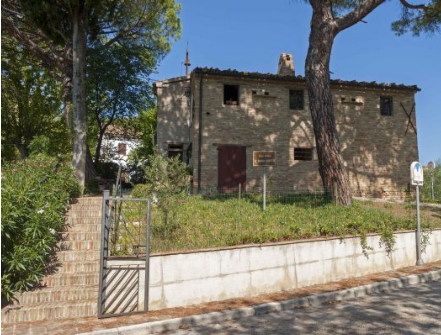
birthplace of santa maria goretti in corinaldo, marche, italy

Era el 6 julio de 1902, y por la tarde María, que apenas rondaba los doce años, estaba sentada en lo alto de la escalera de la casa remendando una camisa.