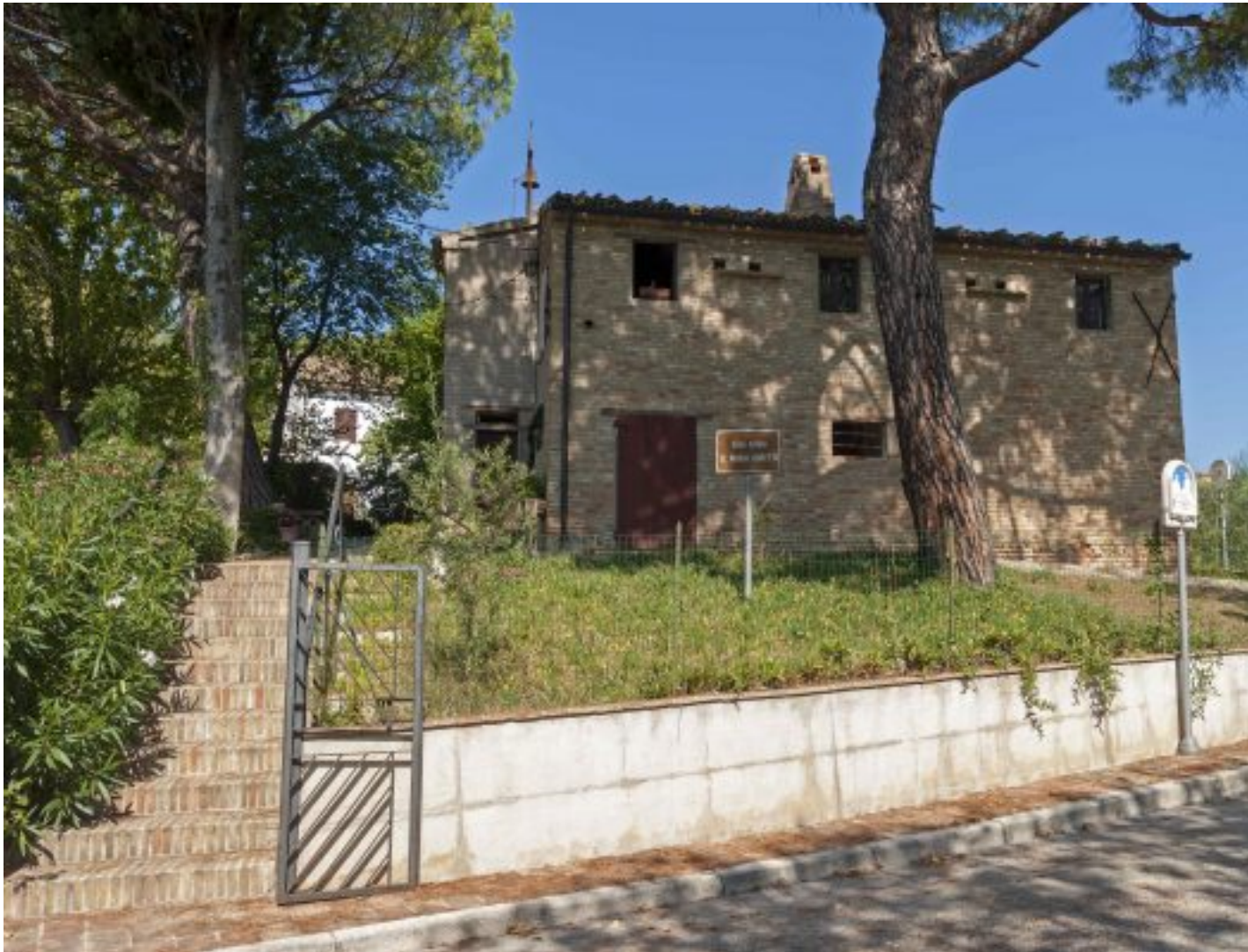
birthplace of santa maria goretti in corinaldo, marche, italy

Era el 6 julio de 1902, y por la tarde María, que apenas rondaba los doce años, estaba sentada en lo alto de la escalera de la casa remendando una camisa.