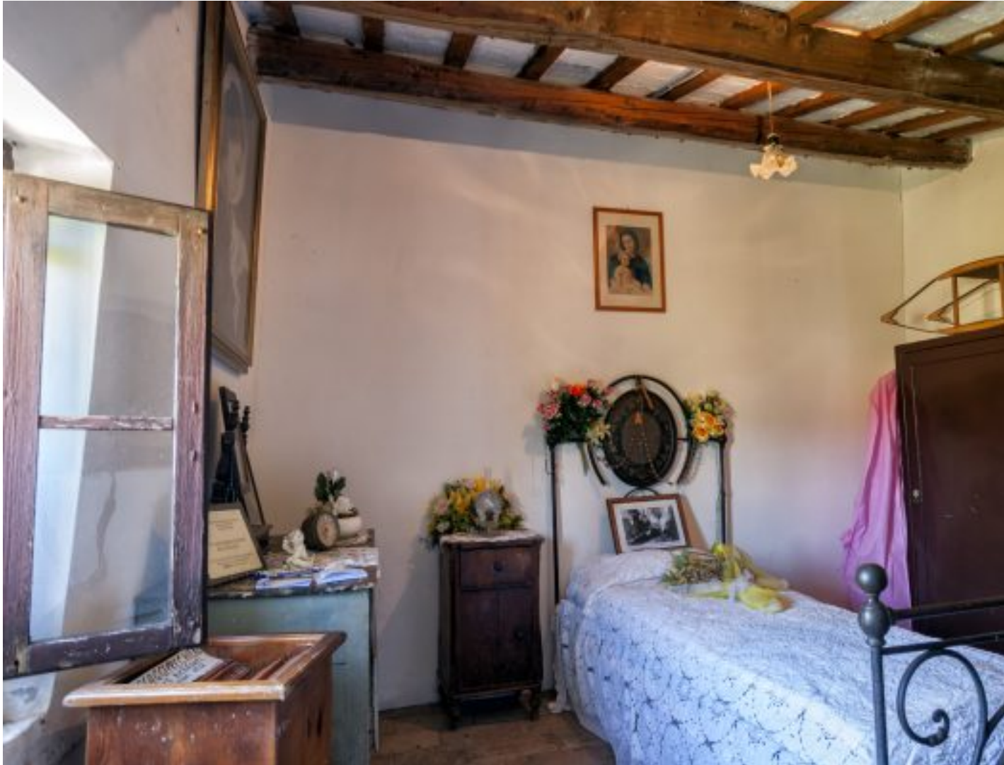
Habitación de santa María Goretti, Italia

“La pureza de corazón, como toda virtud, exige un entrenamiento diario de la voluntad y una constante disciplina interior. Requiere, ante todo, invocar asiduamente a Dios en la oración”.