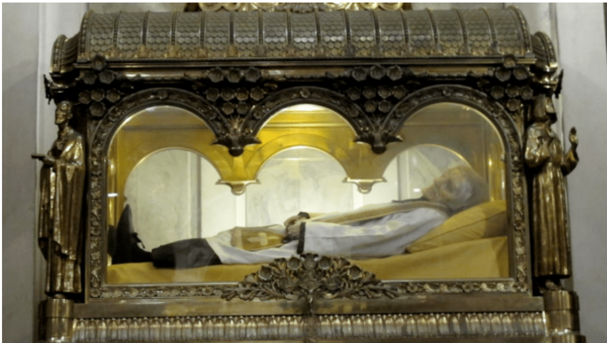
Cuerpo incorrupto del Santo Cura de Ars

En la noche del 3 de agosto llegó su obispo. El santo lo reconoció, pero no pudo decir palabra alguna. Hacia la medianoche el fin era inminente. A las 2:00 a.m. del 4 de agosto de 1859, el Obispo leyó: « Que los santos ángeles de Dios vengan a su encuentro y lo conduzcan a la Jerusalén celestial », el Cura de Ars encomendó su alma al Señor al que había dedicado toda su vida. Como los santos, este artículo explica quienes son los santos .