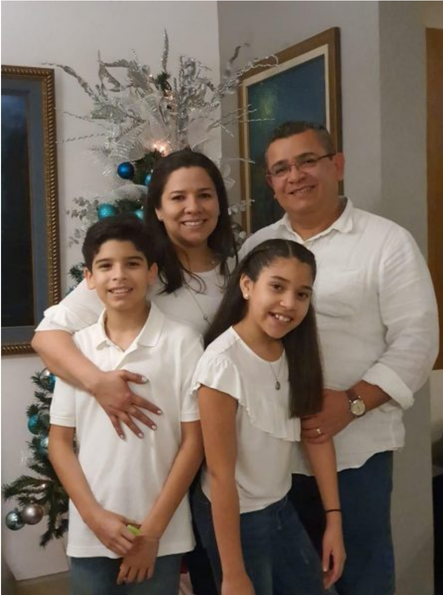
Una de las familias que ha recibido la Capillita Peregrina de Fátima en El Salvador

Orar ha sido el mensaje más importante de nuestra madre María.